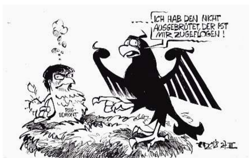
Spanischer Kuckuck. HAITZINGER

Was die Leute auf dem Herzen haben, schildert Uricher in einem jüngsten Fall: Ein Ehepaar, beide um die 60, besitzt ein Haus am Bodensee und eine Wohnung in Hamburg. Dort lebt die Tochter. Im Haus ziehen die Eltern ins Dachgeschoss, den Rest nutzt der Sohn. Ihm wollen die Eltern das Haus schenken, die Tochter erhält die Wohnung. „In dem Fall wird der Wert von Haus und Wohnung ermittelt, damit die Kinder beide gleich viel erhalten“, sagt Elmar Uricher. Dabei mindert das Nutzungsrecht im Dachgeschoss den Wert für den Sohn. Unterm Strich bleibt dennoch eine „kleine Abfindung“ für die Schwester. Erbschaftsteuer fällt keine an, und wenn sie doch droht, wird die Schenkung einfach auf zwei oder drei Tranchen verteilt. „Denn alle zehn Jahre kann der Freibetrag von Neuem ausgeschöpft werden“, sagt der Anwalt.